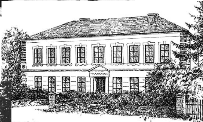
Neue Schule, 1899/1900 erbaut