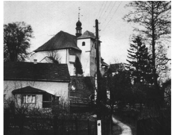
Kirche um 1900 mit Schulgassel