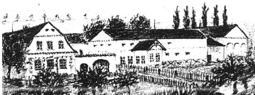
Erbrichterei, eine Anlage in niedersächsischem Baustil