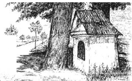
Kobers Kapelle (v. 1836, 1946 abgetragen)