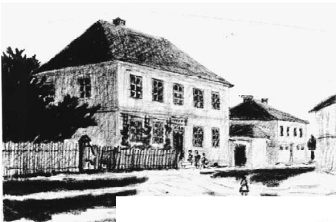
Alte Schule Groß-Olbersdorf 1837 erbaut