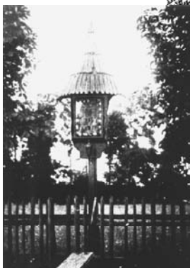
Bildstock in Groß-Olbersdorf in Erinnerung an den Meteor von 1820