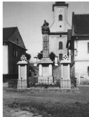
Kriegerdenkmal (vor 1945)