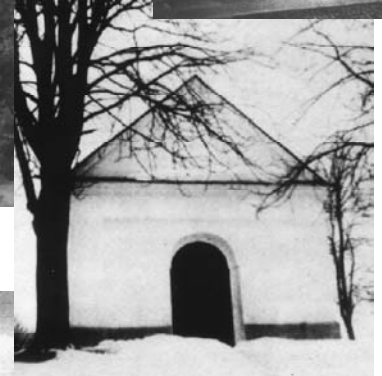
St. Anna Kapelle, Innenansicht (oben)