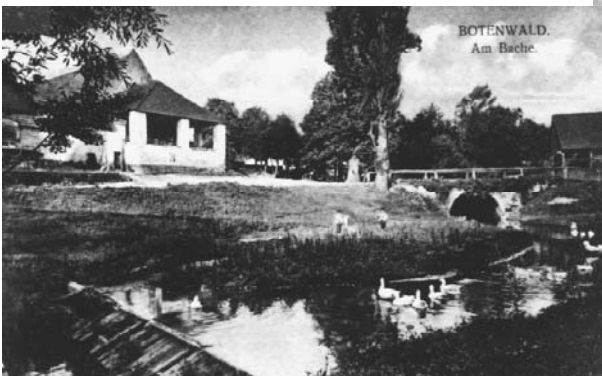
Oberdorf (um 1925)