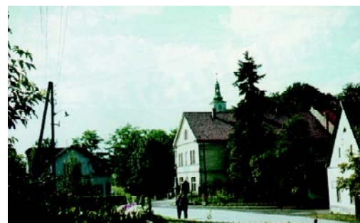
Tor des Meierhofes aus dem 17. Jh.