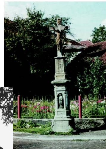
Kreuz im Dorf bei Kukla-Bäcker*