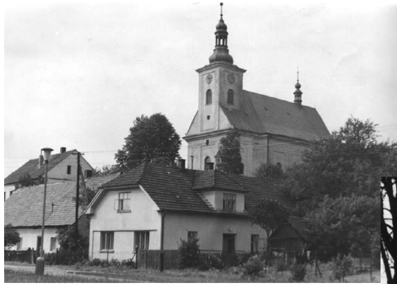
Dorfkirche Allerheiligen (1775/1781)