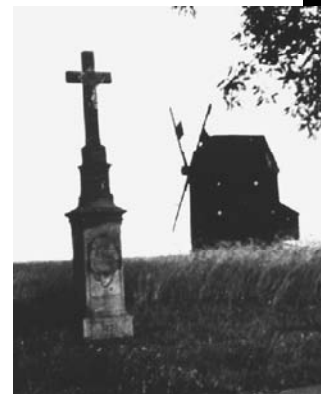
Stuchlynmühle mit Wegkreuz