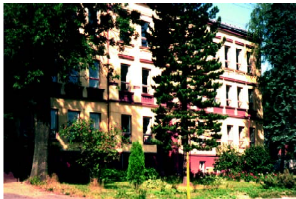
Volks- und Bürgerschule, erbaut 1908 (1992)